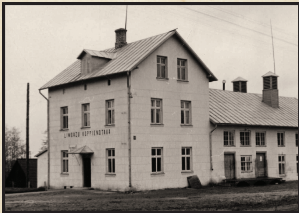
Limbažu pienotava, kuras veikals tirgoja arī svaigas zivis.