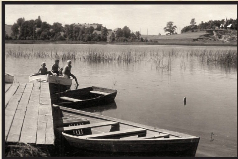
Vasara Lielezera krastā

Augusts solīja dot vietu tikpat veiksmīgam septembrim. Taču tad Vācija izlēma uzbrukt Polijai un Latvijā no 1939.gada 3.septembra sākās kara ekonomikas laiks. Latviešu tautsaimniecība nonāca starptautiskā izolācijā starp karojošām valstīm un līdz liktenīgajam 1940.gada jūnijam iestājās tā saucamais "blokādes gads". Ulmanis joprojām vadīja valsti, taču īstu ulmaņlaiku vairs nebija. Piesaucot tā brīža Latvijā populārākā romāna titulu, tie bija aizgājuši kara vējiem līdz.