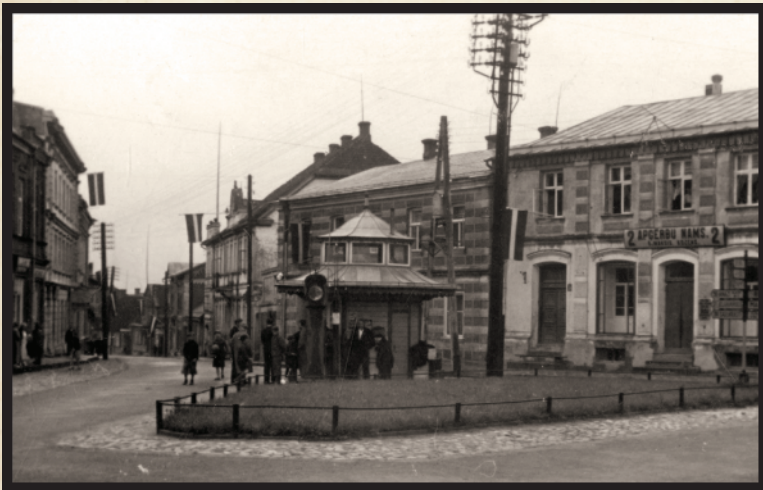
Baumaņu Kārļa laukums svētkos.