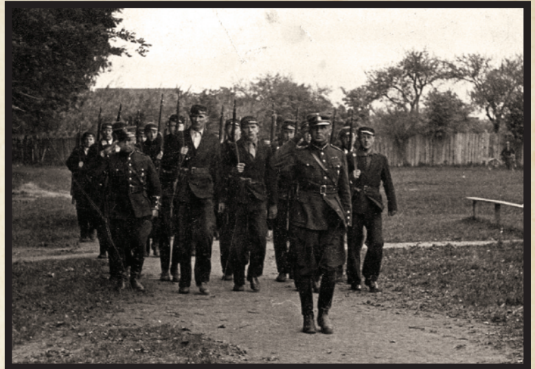
Limbažu ģimnāzisti parādes solī.

1938.gada sākumā pēc Bērziņa iniciatīvas pieņemtais likums ļāva arestēt uz diviem-trim mēnešiem jebkuru personu, ko nejaušs garāmgājējs apsūdzēja "baumošanā". Par lielu cieņu Limbažu miertiesnesim Ozolam jāsaka, ka atšķirība no dažiem saviem kolēģiem Zemgalē vai Latgalē, viņš šo likumu faktiski nepielietoja. Pateicoties savam politiķa "talantam", nepilnu trīs gadu laikā Alfrēds Bērziņš pamanījās sagraut Ulmaņa reputāciju mazturīgās tautas daļas acīs, veicināt pilsētu strādnieku un inteliģences nepatiku pret Zemnieku Savienību un dot PSRS uzturētajiem agitatoriem spēcīgus argumentus. Pats Ulmaņa mantinieka godā sevi jau iecēlušais ministrs izlikās nemanam, ka ir stipri nemīlēts pat amatpersonu vidū un regulāri ceļoja, izklāstot Vadoņa gribu pavalstniekiem.