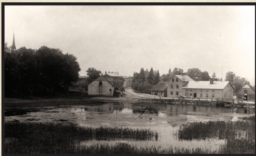
Limbaži no Mazezera puses.