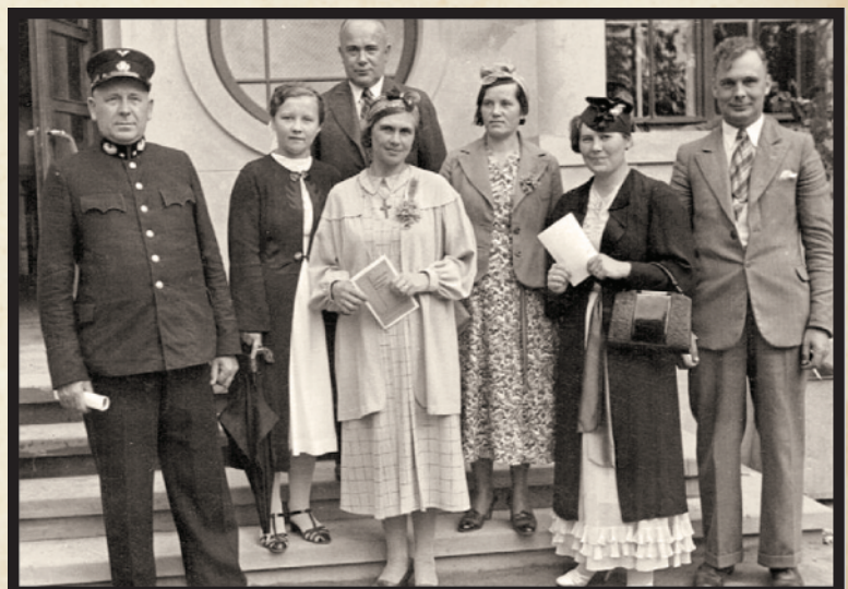
Pie parka paviljona Limbažu dziesmu svētkos.