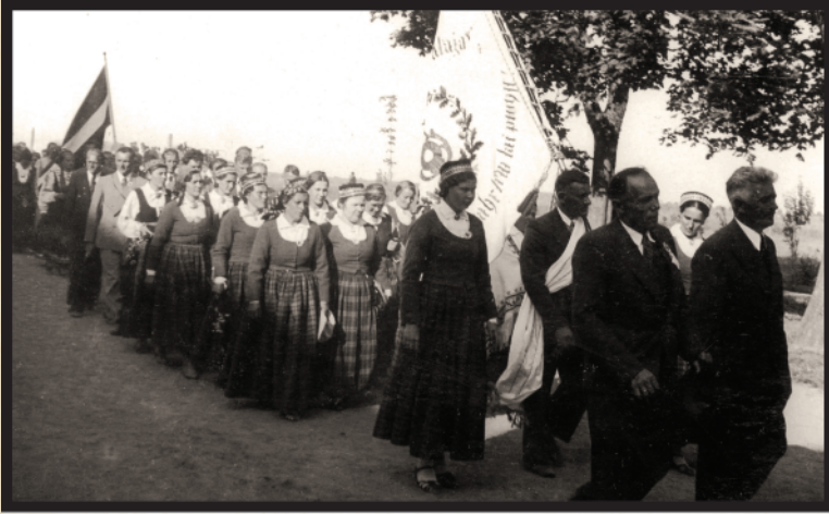
Limbažu koris Dikļu dziesmu svētkos.

Kopš 1864.gadā notikušās latviešu koru pirmās pulcēšanās Dikļos, ko nereti dēvē par pirmajiem dziesmu svētkiem, bija pagājuši 75 gadi. 1939.gada 28.jūnijā Dikļos sāka būvēt estrādi ar 5000 sēdvietām, lai uzņemtu viesus 16.jūlijā paredzētajiem jubilejas Dziesmu svētkiem. Par virsdiriģentu bija izraudzīts Teodors Kalniņš, kurš mēģinājumos uzslavēja Limbažu Saviesīgās biedrības kori, un tika gaidīta arī paša Kārļa Ulmaņa ierašanās. Dikļu dziesmu svētki izvērtās par milzīgu pasākumu ar 5000 dziedātājiem un kopējo apmeklētāju skaitu līdz 30 tūkstošiem. Ieradies uz svētkiem kopā ar krietnu daļu kabineta, Ulmanis pārnakšņoja tikko uzceltajā Puikules stacijā un kopā ar iekšlietu ministru Veitmani devās braucienā uz Pāles pagastu, Salacgrīvu, Mazsalacu un Ainažiem. Īpašie Rīgas - Puikules vilcieni uz svētkiem un atpakaļ brauca pārpildīti līdz pēdējai iespējai. Limbažu stacijas pārtikas un dzērienu krājumi tāda pūļa uzplūdiem nebija paredzēti. Rīgas presē parādījās sūdzības par Limbažu stacijas darbiniekiem, kas prasījuši par dzēriena pudeli divreiz dārgāk kā Rīgā, kas patiesībā bija nevis dzelzceļnieku, bet privātu tirgotāju griba.