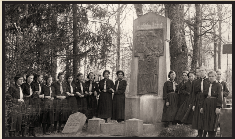
Baumaņu Kārļa kapa piemineklis